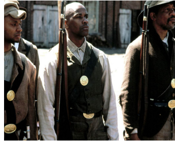
1989 GLORY (Glory) d'Edward Zwick avec Jihmi Kennedy, Morgan Freeman