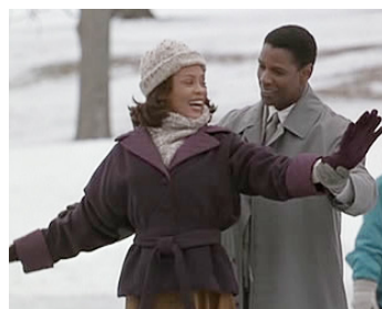
1997 LA FEMME DU PASTEUR (The Preacher's Wife) de Penny Marshall avec Whitney Houston