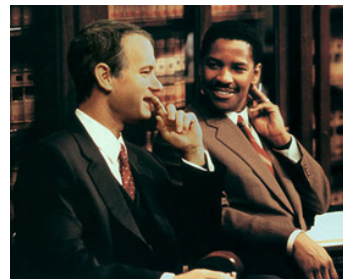
1993 PHILADELPHIA (Philadelphia) de Jonathan Demme avec Tom Hanks