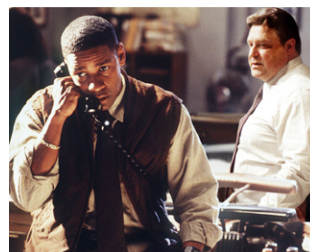
1998 LE TÉMOIN DU MAL (Fallen) de Gregory Hoblit avec John Goodman