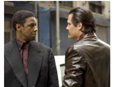
2007 AMERICAN GANGSTER (American Gangster) de Ridley Scott avec Josh Brodin