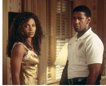
2004 OUT OF TIME (Out of Time) de Carl Franklin avec Sanaa Lathan