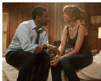
2012 FLIGHT (Flight) de Robert Zemeckis avec Kelly Reilly