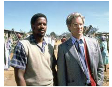
1987 CRY FREEDOM (Cry Freedom) de Richard Attenborough avec Kevin Kline