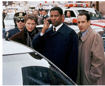
1998 COUVRE-FEU (The Siege) d'Edward Zwick avec Annette Bening, Tony Shalhoub