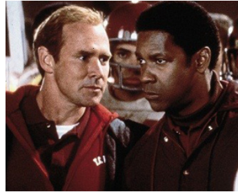
2000 LE PLUS BEAU DES COMBATS (Remember the Titans) de Boaz Yakin avec Will Patton