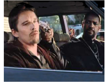
2001 TRAINING DAY (Training Day) d'Antoine Fuqua avec Ethan Hawke