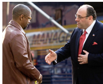
2009 L'ATTAQUE DU MÉTRO 123 (The Talking of Pelham 123) de T. Scott avec James Gandolfini