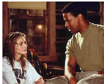
1993 L'AFFAIRE PÉLICAN (The Pelican Brief) d'Alan J. Pakula avec Julia Roberts