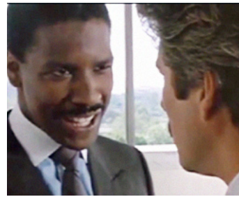
1986 LES COULISSES DU POUVOIR (Power) de Sidney Lumet avec Richard Gere