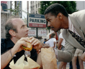
1990 UN ANGE DE TROP (Heart Condition) de James D. Parriot avec Bob Hoskins