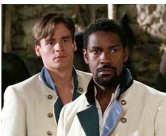
1993 BEAUCOUP DE BRUIT POUR RIEN (Much Ado about nothing) de K. Branagh avec Robert Sean Leonard