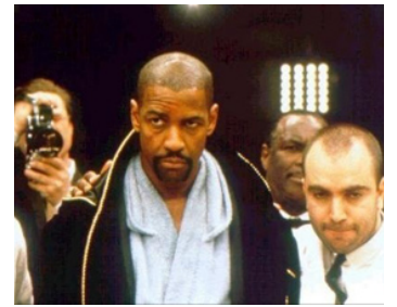
1999 HURRICANE CARTER (The Hurricane) de Norman Jewison