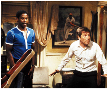
1981 CARBON COPY (Carbon Copy) de Michael Schultz avec George Segal