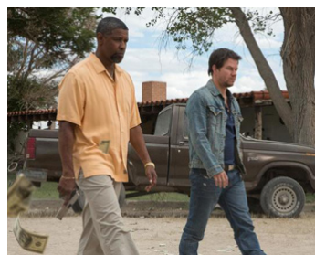
2013 TWO GUNS (2 Guns) de Baltasar Kormákur avec Mark Wahlberg