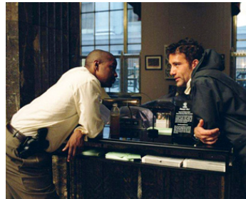
2006 INSIDE MAN, L'HOMME DE L'INTÉRIEUR (Inside Man) de Spike Lee avec Clive Owen