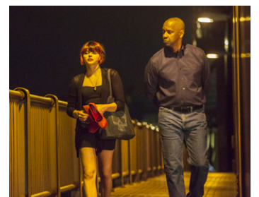
2014 EQUALIZER (The Equalizer) d'Antoine Fuqua avec Melissa Leo