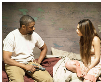
2010 LE LIVRE D'ELI (The Book of Eli) d'Albert et Allen Hughes avec Milla Kunis