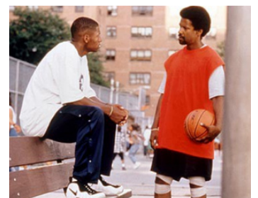
1998 HE GOT GAME (He Got Game) de Spike Lee avec Ray Allen