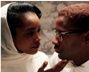
1992 MALCOLM X (Malcolm X) de Spike Lee avec Angela Bassett