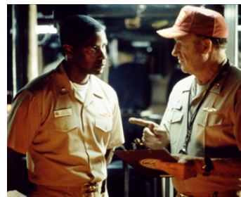
1995 USS ALABAMA (USS Alabama) de Tony Scott avec Gene Hackman