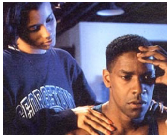
1990 MO'BETTER BLUES de Spike Lee avec Cynda Williams