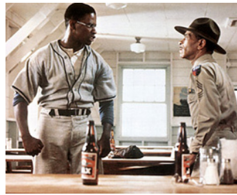
1984 SOLDIER'S STORY (A Soldier's Story) de Norman Jewison avec Sid Caesar