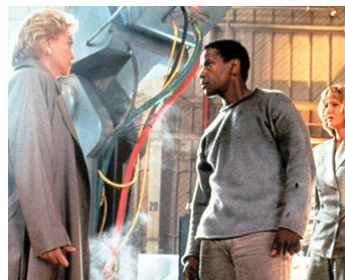
1995 PROGRAMMÉ POUR TUER (Virtuosity) de Brett Leonard avec Louise Fletcher, Kelly Lynch