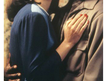
1995 LE DIABLE EN ROBE BLEUE (Devil in a Blue Dress) de Carl Franklin avec Jennifer Beals