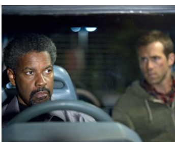
2012 SÉCURITÉ RAPPROCHÉE (Safe House) avec Daniel Espinosa avec Ryan Reynolds