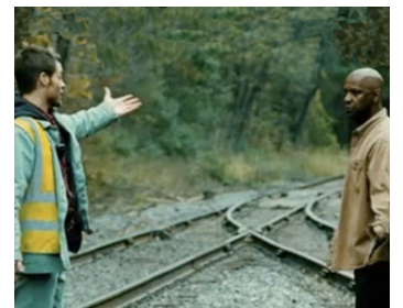
2010 UNSTOPPABLE (Unstoppable) de Tony Scott avec Chris Pine