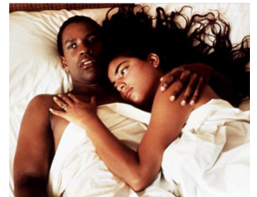
1991 MISSISSIPPI MASALA de Mira Nair avec Sarita Choudhury