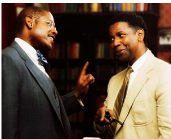
2007 THE GREAT DEBATERS de Denzel Washington avec Forest Whitaker