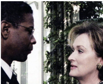
2004 UN CRIME DANS LA TÊTE (The Manchurian Candidate) de J. Demme avec Meryl Streep