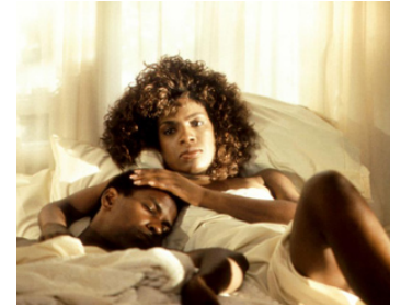
1989 THE MIGHTY QUINN (The Mighty Quinn) de Carl Schenkel avec Sheryl Lee Ralph