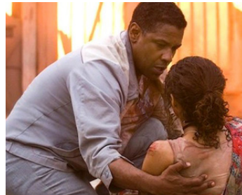
2006 DÉJÀ VU (Déjà Vu) de Tony Scott avec Paula Patton