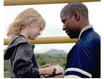
2004 MAN ON FIRE (Man on Fire) de Tony Scott avec Dakota Fanning